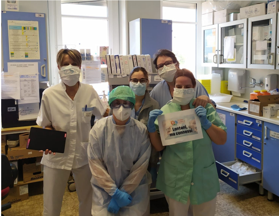
Figura 2 - Ospedale di Trento

Le strutture interessate hanno mostrato la loro riconoscenza, oltre che con lettere di riscontro e ringraziamento, con alcune foto di cui riportiamo qui un campione.