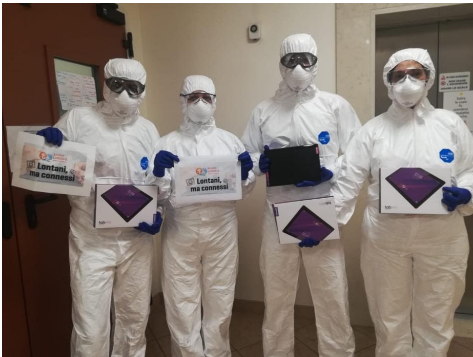
Figura 3 - Ospedale di Treviso San Camillo